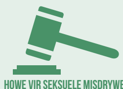
HOWE VIR SEKSUELE MISDRYWE

Die idee van howe vir seksuele misdrywe is in Suid-Afrika ontwikkel. In 2013 is 'n nuwe model vir howe vir seksuele misdrywe ontwikkel, wat alles uiteensit wat nodig is vir 'n hof om 'n hof vir seksuele misdrywe te wees. Hierdie model vereis van hierdie howe om spesiaal opgeleide aanklaers*, hofondersteuners en landdroste** te hê. 'n Hof vir seksuele misdrywe het 'n aparte hofsaal. Dit het ook 'n getuigkamer met geslote kringtelevisietoerusting, waar kinders kan getuig sonder om die verkragter of seksuele oortreder van aangesig tot aangesig hoef te sien, terwyl hulle praat oor wat gebeur het.